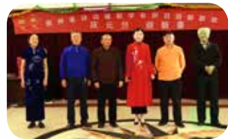
《贵州诗联》编辑部答谢一年来支持编辑工作的广大诗友。