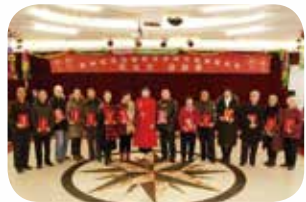
《好家风好家训》楹联征集赛部分获奖人员合影留念。